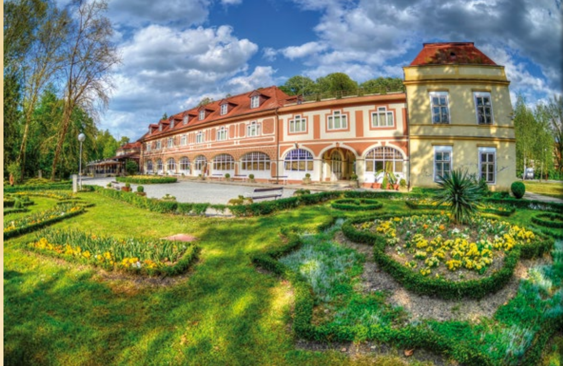
Daruvarske toplice, Vila Arcadia