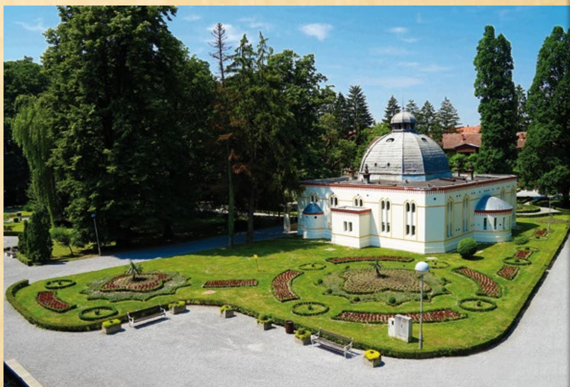
Daruvarske toplice, Centralno blatno kupalište